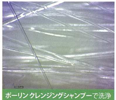
ポリビニルピロリドン系シャンプーで洗浄

【試験DATA】青色染料で着色した、シリコーン配合ヘアオイルを白髪100%毛束に塗布。(200倍拡大)