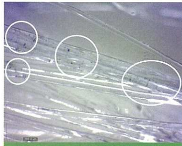
高級アルコール系シャンプーで洗浄

【実証】 すっきり ヌードな髪にして、 次の技術を スムーズに。 ○部分：シリコーン配合ヘアオイルが 残っている状態