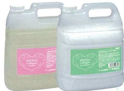
アモロス アミノコラーゲンシャンプー アモロス アミノコラーゲンヘアトリートメント 各 4000mL 美容技術者専用