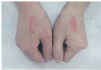
右手：一般的な業務用シャンプー 左手：アミノコラーゲンシャンプー