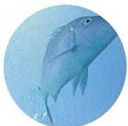
鯛ウロココラーゲン

新鮮な真鯛のウロコ部分から、酵素抽出した保水作用の高い鯛ウロココラーゲンを配合。 さらにトリートメントにはオリーブオイルも配合し、“ハネ・パサつき”の原因となる『乾燥』 から髪を守り、うるおいのあるしなやかな髪へ導きます※水溶性コラーゲン<保湿剤>