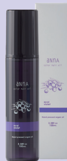
アンナ カラーヘアオイル アサイーバイオレット 100mL ¥2,750(税込)

グレイヘア(白髪) ブリーチヘア アッシュ系ヘアカラー ...and others.