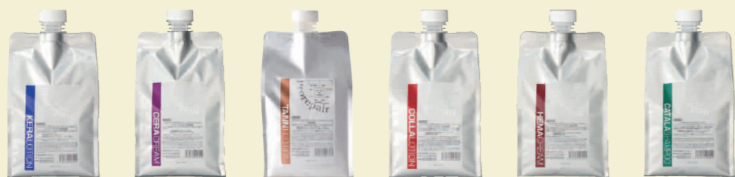
ケラローション セラクリーム タンニローション コラローション ヘマクリーム カタラシャンプー

プロリペア Prorepair シリーズとの組み合わせで、更に充実した多彩なメニュー展開も!