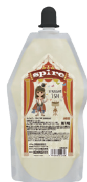
スパイアー 1SH 1剤 400g 医薬部外品

1 剤は、“ 浸透型ステロール ※1”と“ L-アルギニン ”のバランス処方で、 すみずみに拡散・浸透し、薬剤パワーを最大限に発揮させて、 パワフル&スピーディーなストレート技術を可能にしました。 さらにアミノ酸である“ L-アルギニン ”が、内部の『 CMC 』を整え、 毛髪を強化します。また、平均分子量30,000の 高分子ケラチン PPT ※2 配合で、毛髪表面のダメージを補修するとともに、 アイロン熱から髪を守ります。