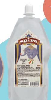
スパイアー 2C 2剤 400g