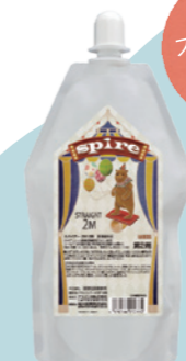
スパイアー 2M 2剤 400mL

シリコンでも樹脂でもない、キュー ティクル保護成分『 PQ37 ※3』配合。 “球状”のものが毛髪表面にしっかり 吸着して、手触りの良い、重厚感のある しっとりとした仕上がりに。