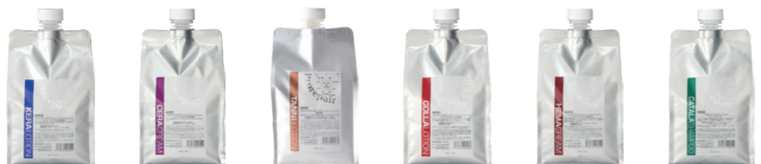
ケラローション セラクリーム タンニローション コラローション ヘマクリーム カタラシャンプー

プロリペア Prorepair シリーズとの組み合わせで、更に充実した多彩なメニュー展開も!