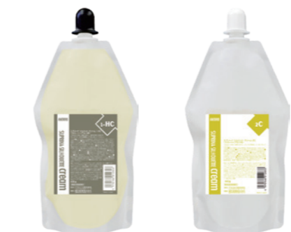
スプリーナ シルエット クリーム 1-HC スプリーナ シルエット クリーム 2C