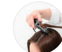
1. 根元部分は、アイロンを2〜3回、速やかにスルー。また、ボリュームを出したいトップ部分等は、やわらかい弧を描くように操作してください。