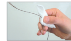
①髪を一束とり、液をコットン等でテンションをかけずにやさしく拭き取ります。