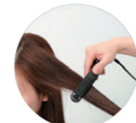
2. 引き出したスライドの根元から毛先にかけて、一定の早さを保って、アイロンをスルーしてください。