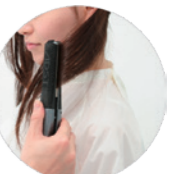
3. 特にクセが強い、ネーブ部分からのスライドは、仕上がりをイメージして、やわらかい曲線やスリーク感を施してください。