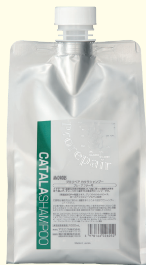
カタラシャンプー 1000mL

1 シャンプーで約90%、 2 シャンプーで約99%の 残留オキシンをキャンセル。