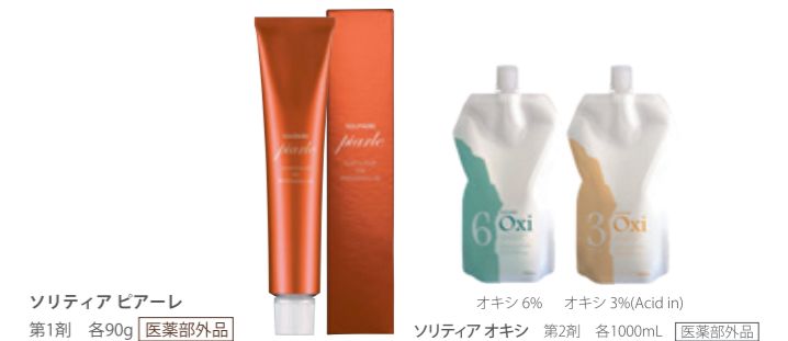
ソリティア ピアーレ 第1剤 各90g [医薬部外品]

マイクロエマルジョン処方により、染料が毛髪内部にしっかりと浸透し、髪の内部から美しい、深みのある髪色に仕上がります。