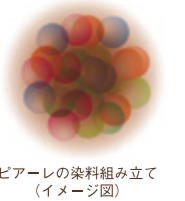
ピアーレの染料組み立て (イメージ図)

ソリティア ピアーレが最もこだわったのが、ベースとなるブラウンの色素配合。いくつもの染料を重ね合わせて生まれたブラウンは、きめ細かなカラー粒子を高密度に含み、これまでにない深い色調を表現。 さまざまな色が少しずつ褪色するため、いつまでも自然な髪色を保ちます。