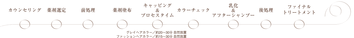
グレイヘアカラー/約20~30分 自然放置 ファッションヘアカラー/約15~30分 自然放置